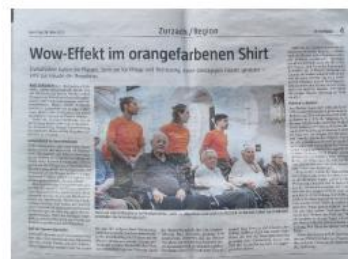
WK Betreuung, Altersheim Pfauen Bad Zurzach