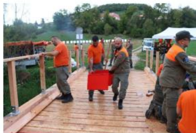
Kaderübung Technische Hilfe, Teambildungsübung