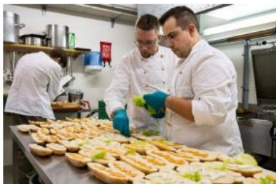
Einsatz Radsporttage und Jodlerfest, Küchenmannschaft