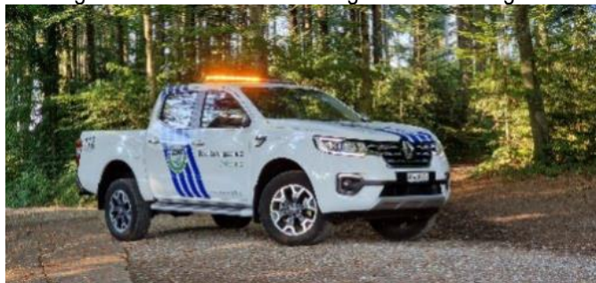
Renault Alaskan MZf (Mehrzweck Fahrzeug)

Neu angeschafft wurden die nachfolgenden Fahrzeuge.