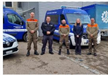
Zusammenarbeit THW - ZSO