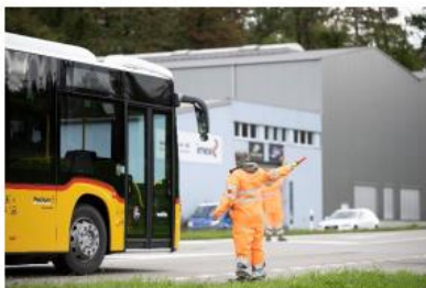
Einsatz Winzerfest, Verkehrsführung