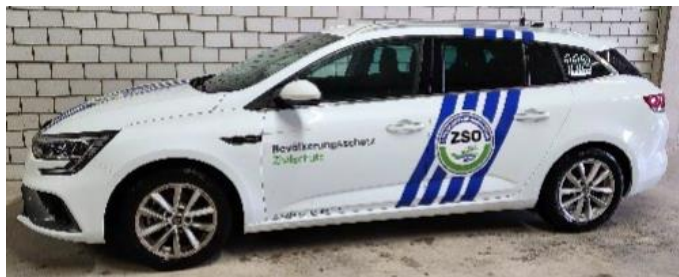
Renault Megane KDF (Kommando Fahrzeug)