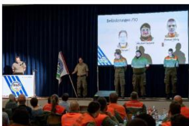
Beförderungen am Bevs-Rapport 2022