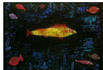
Der Goldfisch – Paul Klee

Es war ein normaler Tag im Fischland und Goldi spielte mit seiner Schwester Luisa und seinem Bruder Luis Fangen, als ihre Mutter Mia sie zum Mittagessen rief. Ihr Papa Praveen kam gerade zurück von der Arbeit, als plötzlich die Sirene losging. Immer wenn die Sirene losging, hiess es, dass der böse Weisse Hai wieder angriff. Der Weisse Hai wollte Goldis Familie fangen, weil sie die einzigen Fische waren, die Gold herstellen konnten. Der Weisse Hai stürzte mit seiner Armee und einem grossen Netz auf die Familie. Nur Goldi konnte davonschwimmen und versteckte sich vor dem Hai. Seine Familie wurde von ihm und seiner Armee ins Land der Haie verschleppt, bis man von ihnen nichts mehr sah.