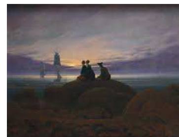
Mondaufgang am Meer – Caspar David Friedrich

Wir befinden uns im Jahre 2000 in einer unterirdischen Halle. Der glatzköpfige Victor schmiedet an den Bauplänen seiner Rakete. Alle seine Helfer wollten die Schrumpf-Waffe erstellen, aber ihnen fehlen die Teile der Schrumpf-Waffe. Drei Tage später: Tim Anna Wilson und John waren auf dem Schulhof. Die Schule war aus und sie gingen zur Straße, doch plötzlich raste ein riesiger Porsche vor ihnen vorbei. Sie fanden das verdächtig. Sie fuhren direkt hinterher. Der Porsche fuhr viel schneller als sie. Nach einer etwa zehnminütigen Fahrt sahen sie einen glatzköpfigen Mann aus dem Porsche steigen. Der Mann gab einen Code ein und sie legten sich auf die Lauer. Danach öffnete sich eine Falltür. Der Mann ging hinunter und Tim sagte: „Wir warten, bis er wieder rauskommt, dann gehen wir rein.“