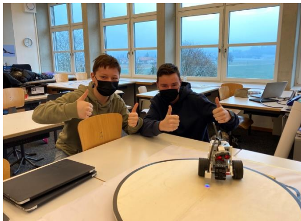
Alle Bilder auf dieser Seite – © Oberstufe Stadel