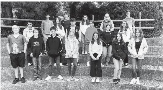
Das neue Schülerparlament