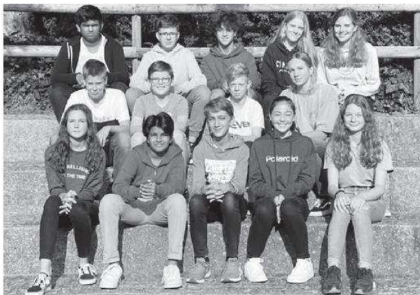
Das neue Schülerparlament – drei Parlamentarier*innen fehlen auf dem Bild