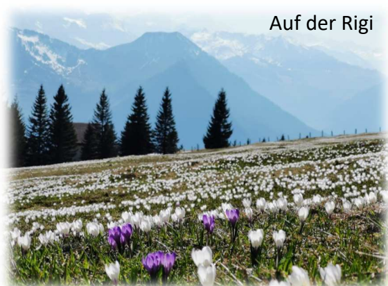
Auf der Rigi