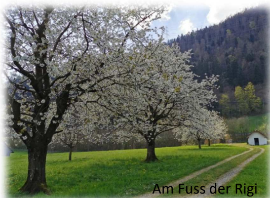
Am Fuss der Rigi