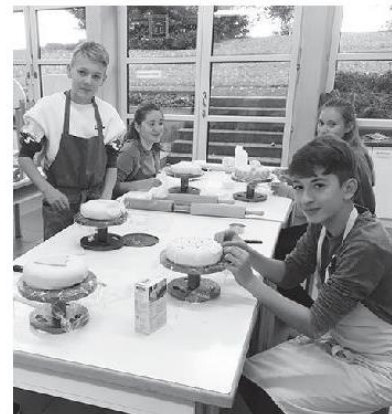
Unsere Schülerinnen und Schüler beim Bühnenbau und beim Verziern von Torten