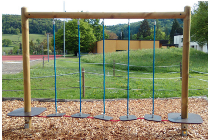
Neues Spielgerät auf dem Spielplatz Kaiserstuhl – Der Hochpfad.

Durch eine noble Spende des Gemeinnützigen Frauenvereins Kaiserstuhl ist nun auf dem Kinderspielplatz beim Schulhaus Blöleboden ein Hochpfad installiert. Der Frauenverein von Kaiserstuhl machte sich noch letztes, Jahr anlässlich einer weiteren verdankenswerten gemeinnützigen Tat, Gedanken über ein neues Spielgerät für die Kleinsten in der Stadt. Beraten durch das Bauamt fiel die Wahl auf einen Hochpfad, der die Auswahl an Spielgeräten auf dem Spielplatz optimal ergänzt. Das Gerät wurde durch die Spende des Frauen-