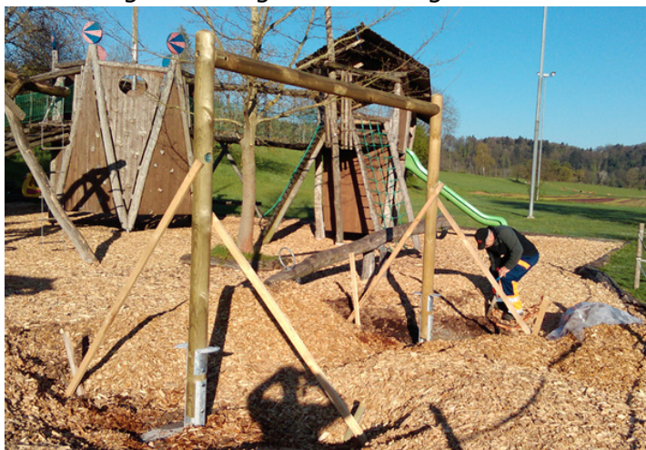
Hochpfad durch das Bauamt Kaiserstuhl errichtet.

vereins aus dem Reingewinn des Bazar-Ertrages ermöglicht und durch einen Zustupf aus dem Budget für Jugendförderung unterstützt. Eingebaut wurde das Gerät fachmännisch vom Bauamt Kaiserstuhl. Dank umsichtiger Planung und gut gepflegten Beziehungen zu umliegenden Part-