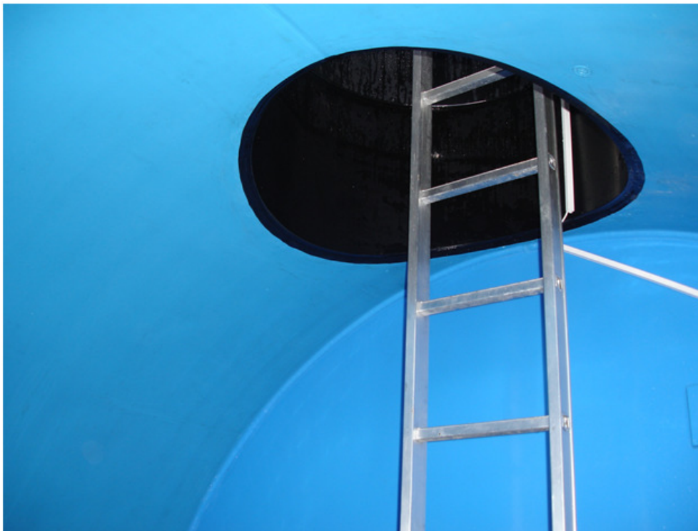
Einstieg in das 20m 3 fassende Wasserbecken des Reservoirs Hasli.