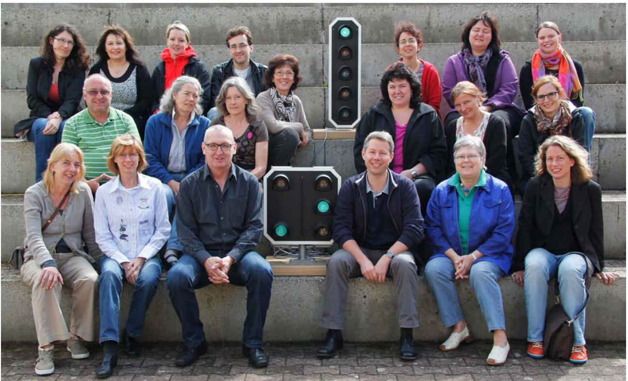
Freie Fahrt für Team und Schulführung der Kreisprimarschule Belchen

Der Evaluationsbericht kann auf unserer Homepage www.kpsb.ch eingesehen und heruntergeladen werden.