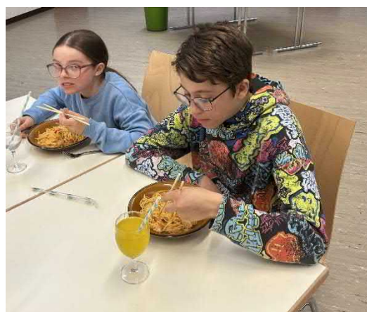
Mit den Stäbli essen .....