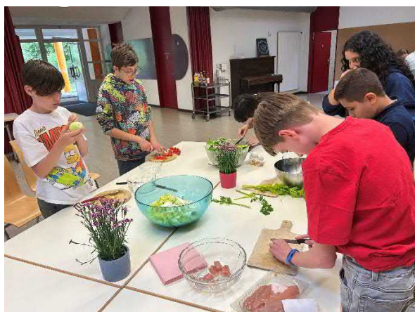
Im Team Gemüse rüsten 😊

Der Kulturverein Fisibach darf auf einen rundum gelungenen Anlass zurückblicken. Die Begeisterung der Kinder zeigte eindrücklich, wie viel Freude gemeinsames Kochen, Lernen und Erleben bereiten kann. Eine Wiederholung dieses Angebots dürfte deshalb bereits jetzt auf grosse Vorfreude stossen.