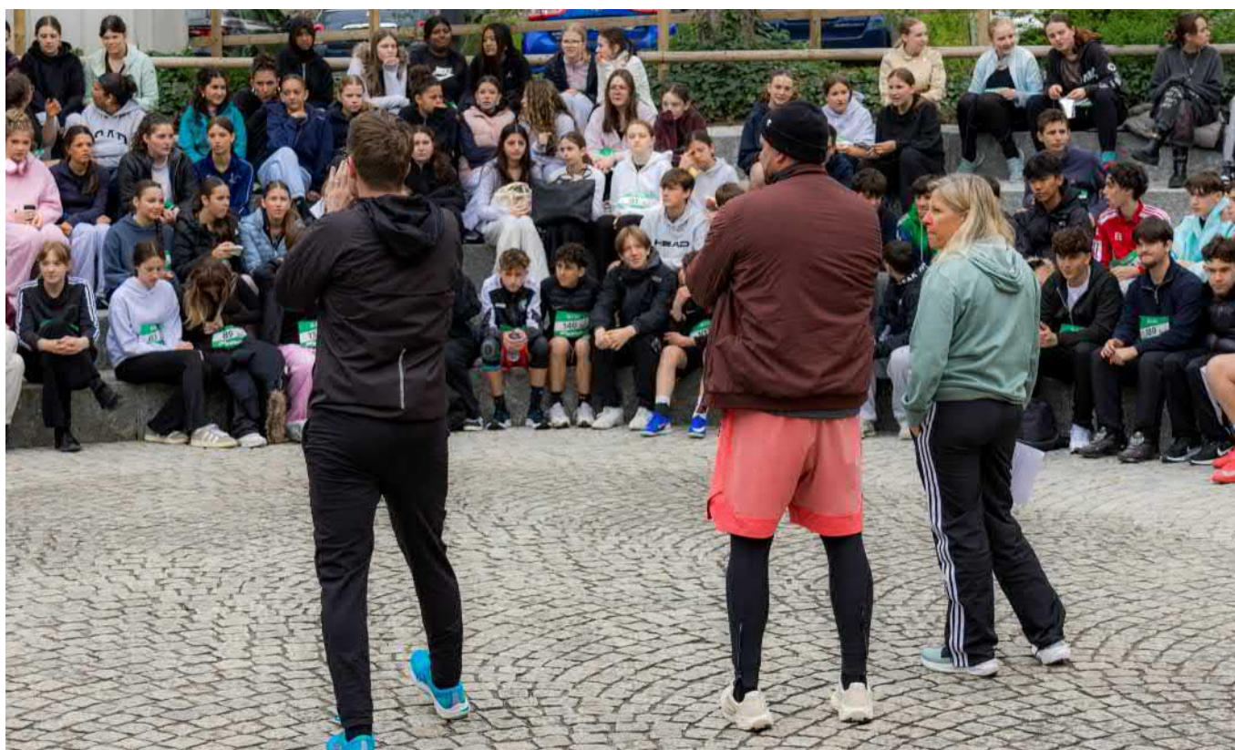
Versammlung und letzte Informationen vor dem Lauf in der Arena.