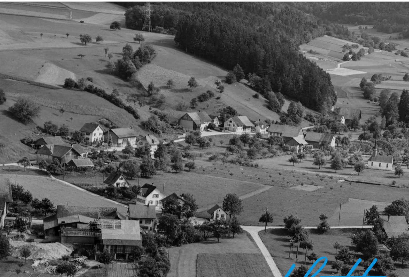
Fisibach, 1953