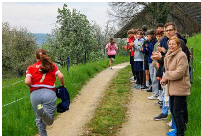
Beim Zieleinlauf werden die Mädchen nochmals von ihren Mitschülern und Lehrpersonen angefeuert.