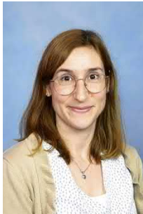
Ein Beitrag von Aline Pfiffner Kindergartenlehrperson Farbtupf

«Schau tief in die Natur, und dann wirst du alles besser verstehen.»